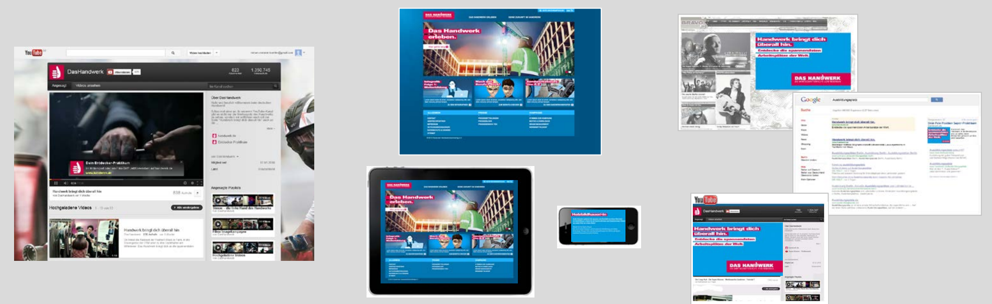
YouTube channel „Das Handwerk“